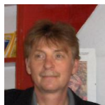
Interjú Tibi bácsival