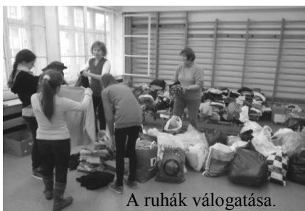
A ruhák válogatása.

A Vörösmarty Karitás november 18-ig ruhagyűjtést szervezett az iskolában. Az adományokért ebben az évben is tombolaszelvényt kaptak a gyerekek, melynek sorsolását a téli szünet előtti napon tartjuk. Az adományozási kedv nem csökkent a tavalyi évhez képest, így a hét végén a rászorulóknak 100 zsák ruha közül válogathattak.